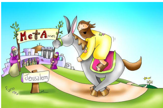
DOMINGO DE RAMOS

DOMINGO DE PASCUA: Jesús resucitó al tercer día.